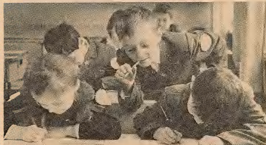
Цінава, што там у суседа?