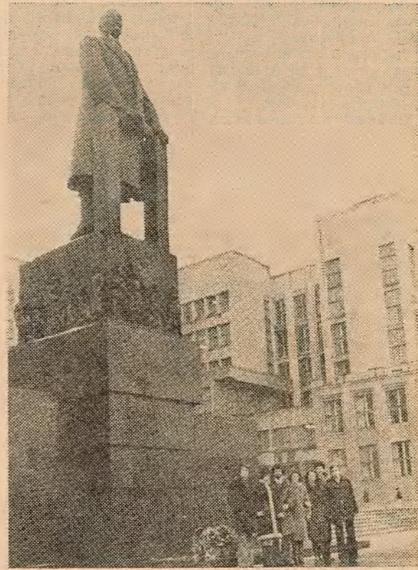
НА ЗДЫМКАХ: выступае Хрыста Ніколаў; балгарскія студэнты ўсклалі кветкі да помніка У. І. Леніну.